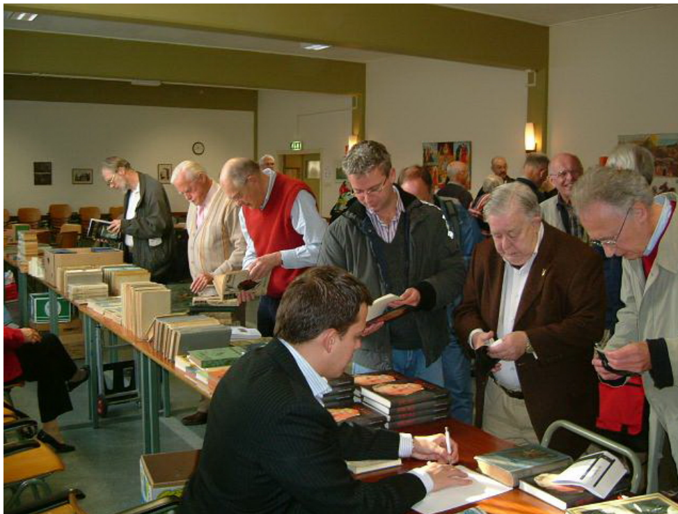
Impressie van Karl May dag, 4 november 2006